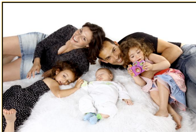
חג חנוכה שמח

עכשיו אחרי שכל המחלוקות עומדות להיפתר (כך שמענו) ושהמיילים קצת נרגעו... הגיעה העת להמשיך ולבנות ישוב לתפארת.